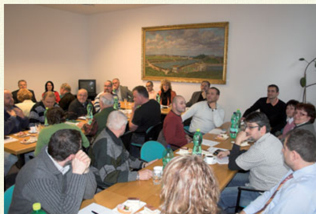
Dne 13. ledna proběhlo na městském úřadě setkání starostů obcí královédvorského regionu. Mezi tématy jednání patřila elektronizace veřejné správy, problematika záklona o pozemních komunikacích nebo povodňový plán obcí.