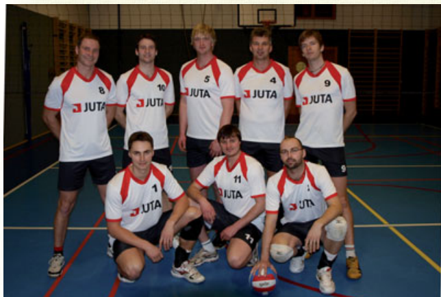
Volejbalisté TJ Dvůr Králové jsou ve skvělé formě. V polovině soutěže jsou na prvním místě a mají nakročeno k postupu do druhé národní ligy. Přijďte je podpořit na poslední tři domácí zápasy. Termíny utkání naleznete v KdeCo.