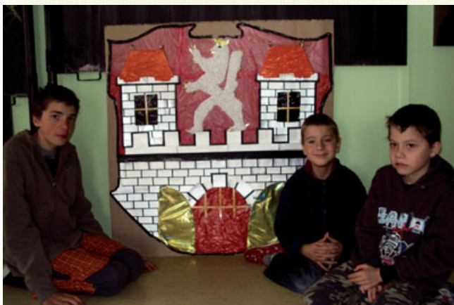
Žáci ze ZŠ a PrŠ v Dvoře Králové nad Labem, kteří se zúčastnili pokusu o vytvoření světového rekordu ve výrobě znaku svého města z odpadového materiálu. V rámci krajské výstavy se umístili na 2. místě. Více na straně 5.