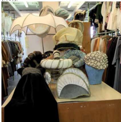
Poklady fundusu BARRANDOV STUDIO, a.s.

Původ barrandovského Fundusu (depozitář nebo laicky řečeno sklad kostýmů a rekvizit) je velmi úzce spjat i se založením Barrandov Studio, které v letošním roce slaví osmdesáté výročí. K nejzajímavějším kusům patří například kostýmy z projektů Císařův pekař a Pekařův císař (1951), Byl jednou jeden král (1954) nebo zde vystavované kostýmy z pohádky Princezna se zlatou hvězdou (1959).