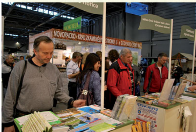
Letos se naše město spolu se sdružením Podzvičinsko účastnilo ve dnech 13.-16.1. brněnského veletrhu Regiontour. Vystavní pult byl tradičně společný se zoologickou zahradou, za město se dále prezentoval pivovar Tambor.