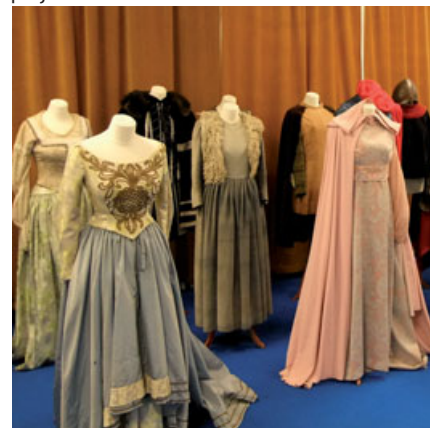
Poznáváte šaty z pohádky Tři oříšky pro Popelku?

S odstupem času se může stát, že hodnota některých kostýmů, jejichž výrobní cena nebyla zpočátku nijak vysoká, může značně stoupnout s ohledem na úspěch filmu, na to, pro koho byl kostým vyroben nebo kdo ho oblékal v dalších projektech.